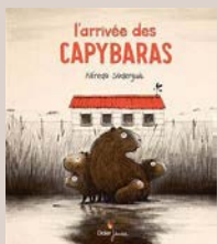
"L'Arrivée des Capybaras" "L'Arrivée des Capybaras" Alfredo Soderguit Didier Jeunesse, 2020