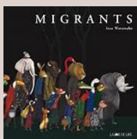
"Migrants" Issa Watanabe La Joie de Lire, 2019