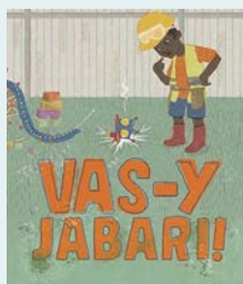
Vas-y Jabari Gaia Cornwall Éditions d'eux, 2022

Les variations de cadrages (plans de face, gros plans sur le visage de l'enfant ou vues plongeantes du haut de l'échelle) mettent en évidence la hauteur du plongeur et les petits lecteurs peuvent partager les sentiments du héros. La présence attentive du père, sa patience et sa douceur sont d'un grand réconfort pour tous.